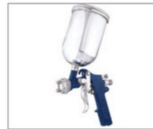
LMG-4 > Gravidade 096 Capacidade da caneca: 550mL Peso: 595g Pressão de trabalho: 30lbs Consumo de ar: 2,5pcm Abertura de leque até aprox. 25cm a uma distância de aprox. 30cm da superfície a ser pintada Bico de 1,5mm