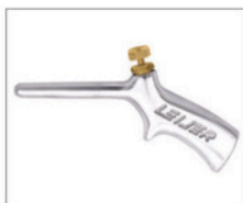
SL-2 > Sopradores 095 Soprador de ar com bico longo