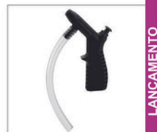
PVL-3 PP > Pulverizadores 095 Pulverizador de fluido com bico curto sem caneca