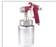
LF-5 > Baixa Produção 099 Capacidade da caneca: 1L Peso: 660g Pressão de trabalho: 25lbs Consumo de ar: 2,5pcm Leque regulável até aprox. 15cm a uma distância de aprox. 30cm da superfície a ser pintada Bico 1,2mm