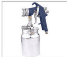
APL-1s > Alta Produção 096 Capacidade da caneca: 1L Peso: 1Kg Pressão de trabalho: 45 a 50lbs Consumo de ar: 10pcm Abertura de leque até aprox. 35cm a uma distância de aprox. 30cm da superfície a ser pintada Bico 1,7mm