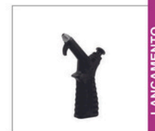
SL-1 PP > Sopradores 090 Soprador de ar bico curto