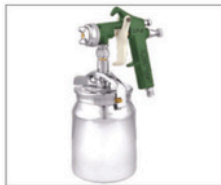
LF-6 > Média Produção 097 Capacidade da caneca: 1L Peso: 800g Pressão de trabalho: 40lbs Consumo de ar: 6,5pcm Leque regulável até aprox. 20cm a uma distância de aprox. 30cm da superfície a ser pintada Bico 1,5mm