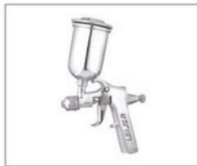
LMG-11 > Gravidade 095 Capacidade da caneca: 150mL Peso: 370g Pressão de trabalho: 15lbs Consumo de ar: 1,5pcm Bico de 0,4 e 0,8mm