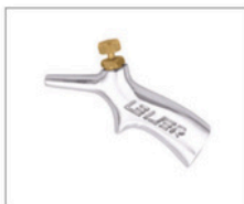
SL-1 > Sopradores 090 Soprador de ar bico curto