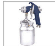
APL-2s > Alta Produção 096 Capacidade da caneca: 1L Peso: 1Kg Pressão de trabalho: 45 a 50lbs Consumo de ar: 10pcm Abertura de leque até aprox. 35cm a uma distância de aprox. 30cm da superfície a ser pintada com regulagem de ar no cabo Bico 1,7mm