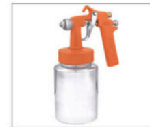
ADL-3 > Ar Direto 098 Capacidade da caneca: 1L Peso: 600g Pressão de trabalho: 25lbs Consumo de ar: 2pcm Duas capas de ar, uma para leque, outra para jato redondo entrada de ar lateral, próprio para trabalhar com compressores de ar direto Bico 1,3mm