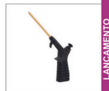
SL-2 PP > Sopradores 095 Soprador de ar com bico longo