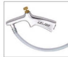
PVL-3 > Pulverizadores 095 Pulverizador de fluido com bico curto sem caneca