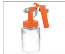
ADL-1 > Ar Direto 090 Capacidade da caneca: 1L Peso: 600g Pressão de trabalho: 25 lbs Consumo de ar: 2pcm Duas capas de ar, uma para leque, outra para jato redondo, próprio para trabalhar com compressores de ar direto Bico 1,3mm