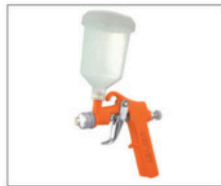
LMG-12 ar direto > Gravidade 098 Capacidade da caneca: 200mL Peso: 370g Pressão de trabalho: 15lbs Consumo de ar: 1,5pcm Caneta em nylon, próprio para trabalhar com compressores de ar direto Bico de 0,4 e 0,8mm