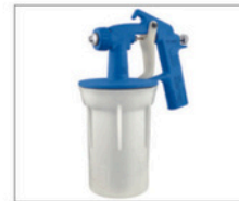
ADL-150 N > Ar Direto 097 Capacidade da caneca: 550mL Peso: 455g Pressão de trabalho: 25lbs Consumo de ar: 2pcm Capa de ar com abertura de leque regulável capa de ar redonda, próprio para trabalhar com compressores de ar direto Bico de 0,4 e 0,8mm