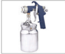
LM-4 > Alta Produção 096 Capacidade da caneca: 1L Peso: 1Kg Pressão de trabalho: 45lbs Consumo de ar: 10pcm Leque regulável até 25cm a uma distância aprox. 30cm da superfície a ser pintada Bico 1,7mm